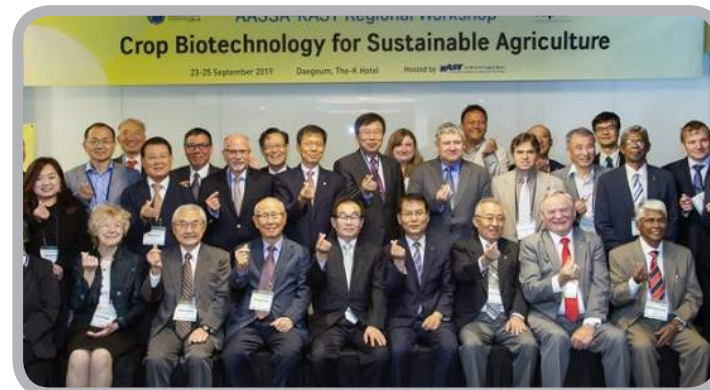
아시아과학한림원(AASSA) 사무국 운영