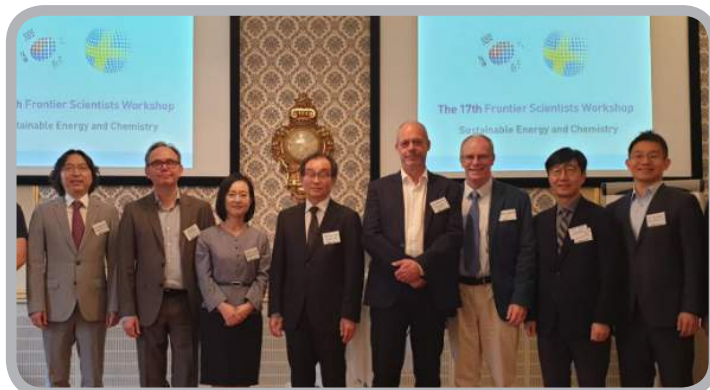
주요 선진한림원과의 공동심포지엄 개최