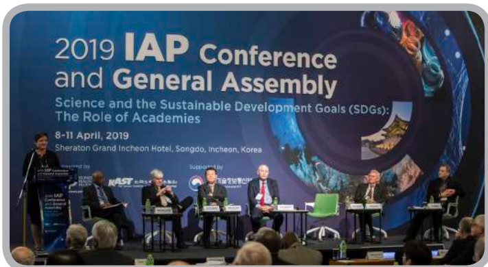
국제과학기술기구 운영 참여 및 국제심포지엄 개최

한국과학기술한림원은 전 세계 37개국 49개 학술기관과 협력관계를 맺고 과학기술 민간외교에 앞장서고 있습니다. 국제과학기술기구 및 해외아카데미와의 공조를 강화하고, IAP for Science 이사국 활동 및 아시아과학한림원연합회(AASSA) 사무국 운영 등을 통해 한국 과학기술의 위상을 드높이며, 한국 과학 기술의 세계화를 도모합니다.